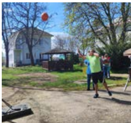
Hod na kôš