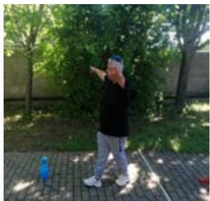
Športovanie v DSS Báhoň