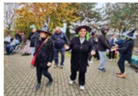
Jesenná zábava v maskách