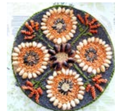
klienti - mužské oddelenie