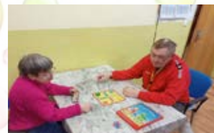
Turnaj v „človeče nehnevaj sa“